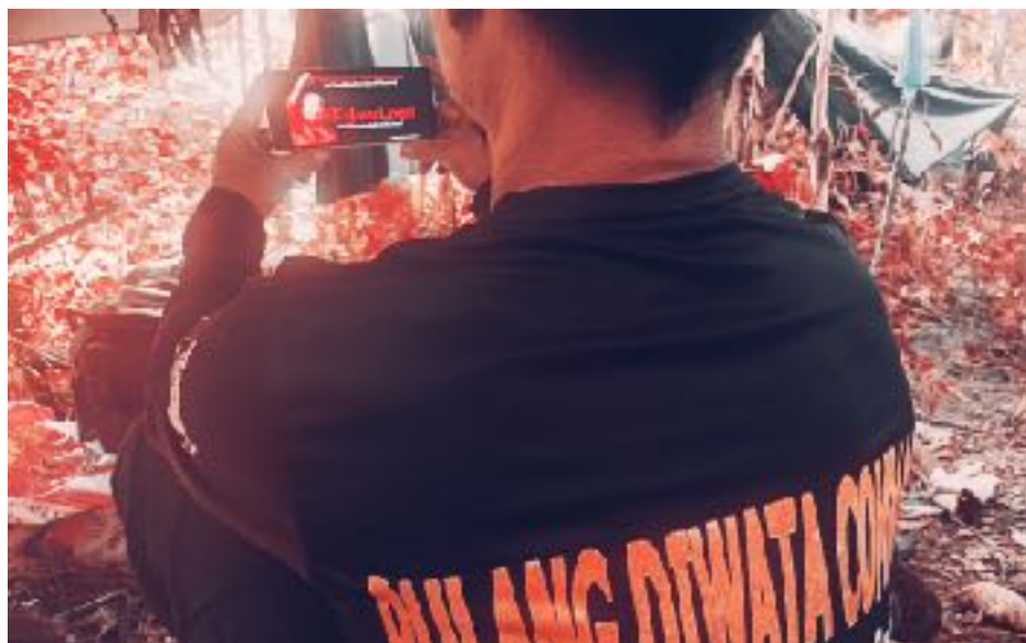
Isang Pulang manggugubat sa Northeast Mindanao nakabalita sa pagpanaw ni Ka Joma

Ang hangganan ng kapangyarihan ng imperyalismong US ay nalantad ng kabiguan nitong saklutin ang yamang langis at magtayo ng 16 na base militar sa Iraq, wasakin ang alyansang Syria-Russia-Iran, wasakin ang rebolusyonaryong pakikibaka ng mamamayang Turkish at Kurdish at hawakan ang Afghanistan na isinurender nito sa Taliban. Sa kasalukuyang sigalot sa pagitan ng Russia at Ukraine, ginagamit ng US ang Ukraine bilang proxy para bantaan at udyukin ang Russia na maglunsad ng gera subalit ang sigalot ay humantong lang sa paglulustay ng rekurso kapwa ng imperyalismong Russia at US. Itinulak din nito ang mga alyado ng US sa NATO na maghinaing kung bakit dapat silang gumastos ng mas malaki para sa suplay sa enerhiya mula sa US kaysa murang langis mula sa Russia.